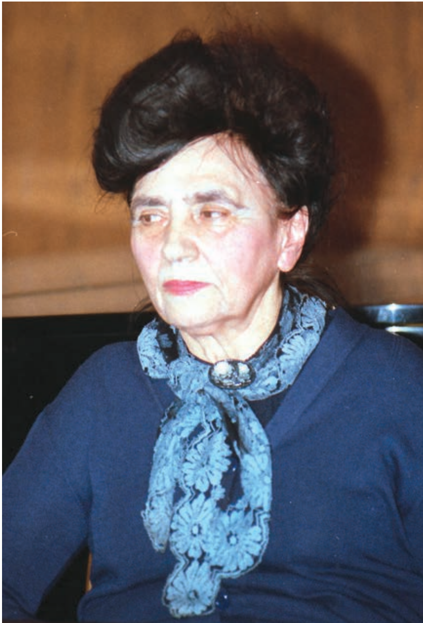
5. Архива Матице српске (фото: Бранко Лучић)