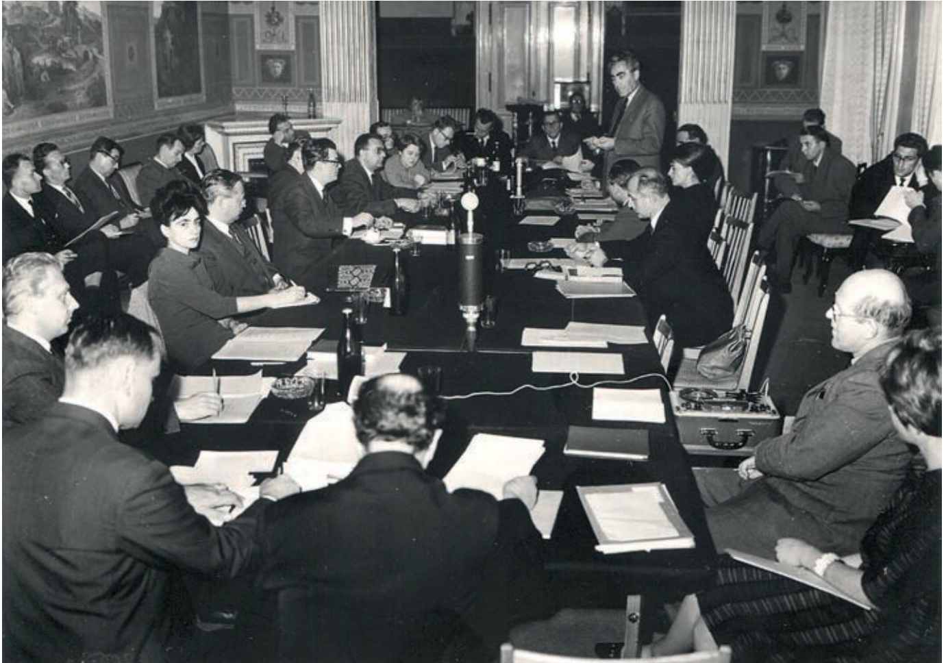
3. Шести Међународни конгрес слависта у Прагу 1968. г.