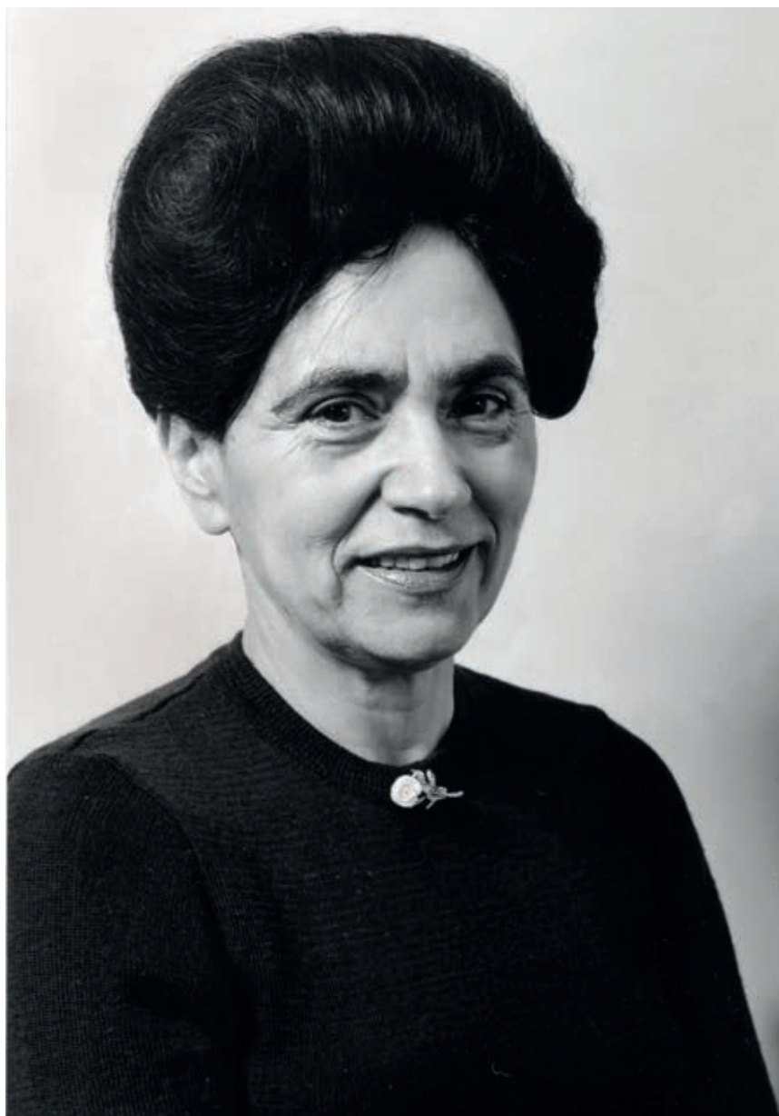
4. САНУ, Библиографско одељење, F-544