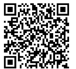
参加登録フォーム

※ZOOMを使用したオンライン会議です。インターネット環境とPC、スマホ、タブレット等があればご自宅やオフィスからお気軽にご視聴いただけます。参加費無料。