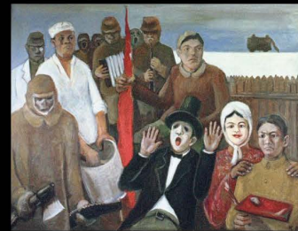
К.Сато «Те, кто выжил»

Выступление будет основано на материалах травматической памяти о жизни в СССР с середины и во второй половине XX в. На основании автобиографических рассказов Масао Миура, рисунков бывших военнопленных Квантунской армии, устных рассказов о депортации в Сибирь калмыков будут обсуждены вопросы стратегий выживания на индивидуальном и групповом уровне. Докладчик показывает, что любой автобиографический нарратив о жизни в тоталитарную эпоху - это имплицитный нарратив о стратегиях выживания. Как вырабатывались эти стратегии и в чем состояли, в чем они были универсальными, а в чем индивидуальными - этому будет посвящен доклад.