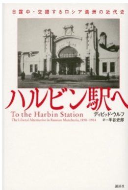
ウルフ教授の著作『ハルビン駅へ』