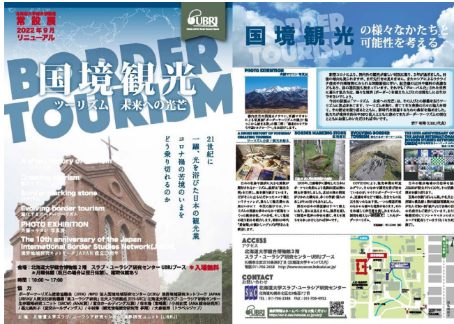
常設展リニューアルに伴い、チラシも作成

境界研究ユニット(UBRJ)は、2022年9月27日から北海道大学総合博物館(2階ブース)の展示内容をリニューアルしました。