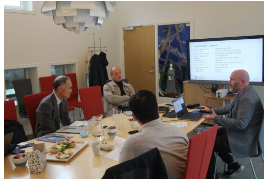
町役場での聞き取り

ったことから、今年度は北部ノルウェーで現地調査を行いました。訪れたのは、ノルウェーのトロムソと、そこから北東に230kmほど離れているハンメルフェストです。この両地域は、ムルマンスクよりも緯度が高く、ハンメルフェストは北緯70度に位置しています。ハンメルフェストは、沖合150kmにノルウェー最大のガス田があり、そこから海中パイプラインで運んだガスをLNGに加工する施設を有しています。ノルウェーは、電力生産のほとんどを水力発電で賄っており、このLNGや南部の沖合で採掘される原油の大半は欧州向けに輸出されています。ハンメルフェストには3日間ほど滞在しただけですが、我々が会って話をした役場の職員やビジネス関係者は、口をそろえてLNGの生産の恩恵を語っていました。LNG企業の払う資産税や寄付により、新しい病院が作られ、教育施設に夜間照明が付けられるといった話、脱炭素にも関係するようないくつもの新たなプロジェクトの開始など、ウクライナでの戦争により経済関係の話はどこの国でも湿りがちになるなかで、久しぶりに明るい未来の話をたくさん聞くことができました。[田畑]