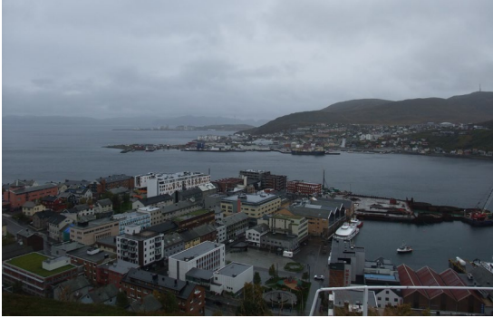
ハンメルフェストの鳥瞰

ったことから、今年度は北部ノルウェーで現地調査を行いました。訪れたのは、ノルウェーのトロムソと、そこから北東に230kmほど離れているハンメルフェストです。この両地域は、ムルマンスクよりも緯度が高く、ハンメルフェストは北緯70度に位置しています。ハンメルフェストは、沖合150kmにノルウェー最大のガス田があり、そこから海中パイプラインで運んだガスをLNGに加工する施設を有しています。ノルウェーは、電力生産のほとんどを水力発電で賄っており、このLNGや南部の沖合で採掘される原油の大半は欧州向けに輸出されています。ハンメルフェストには3日間ほど滞在しただけですが、我々が会って話をした役場の職員やビジネス関係者は、口をそろえてLNGの生産の恩恵を語っていました。LNG企業の払う資産税や寄付により、新しい病院が作られ、教育施設に夜間照明が付けられるといった話、脱炭素にも関係するようないくつもの新たなプロジェクトの開始など、ウクライナでの戦争により経済関係の話はどこの国でも湿りがちになるなかで、久しぶりに明るい未来の話をたくさん聞くことができました。[田畑]