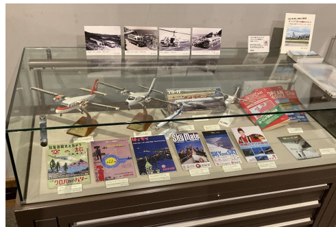
モデルプレーンや機内誌、ツアーポスター(提供:全日空)など貴重な資料が目白押し

境界地域研究ネットワークJAPAN(JIBSN)の設立10周年を記念する特別展示、国境標石、ミニ・コーナーも、リニューアルしてありますのでお楽しみください。 [井上]