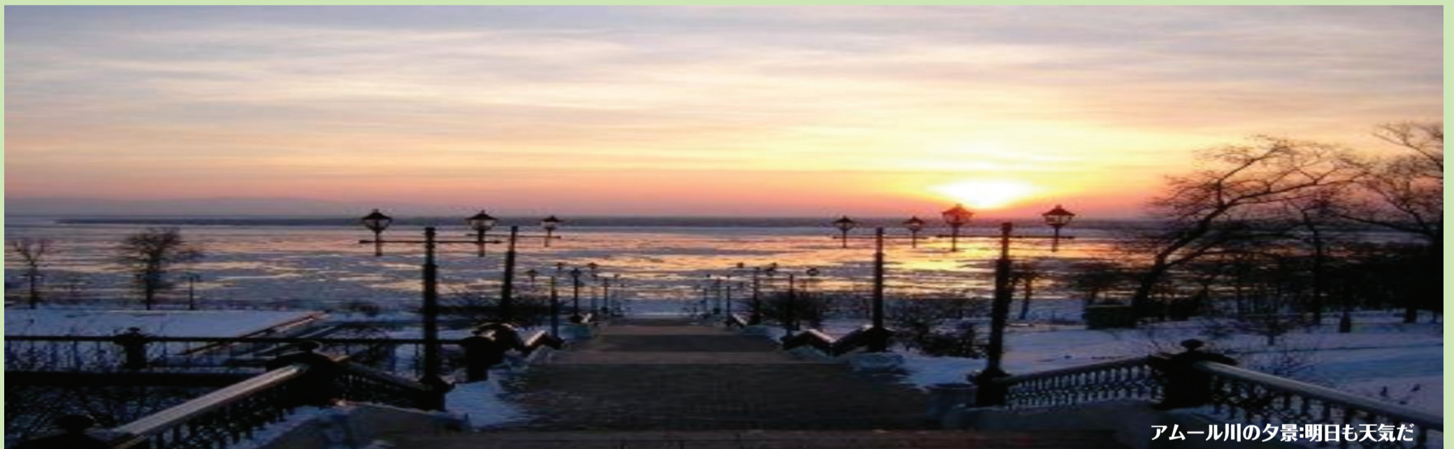
アムール川の夕景：明日も天気だ