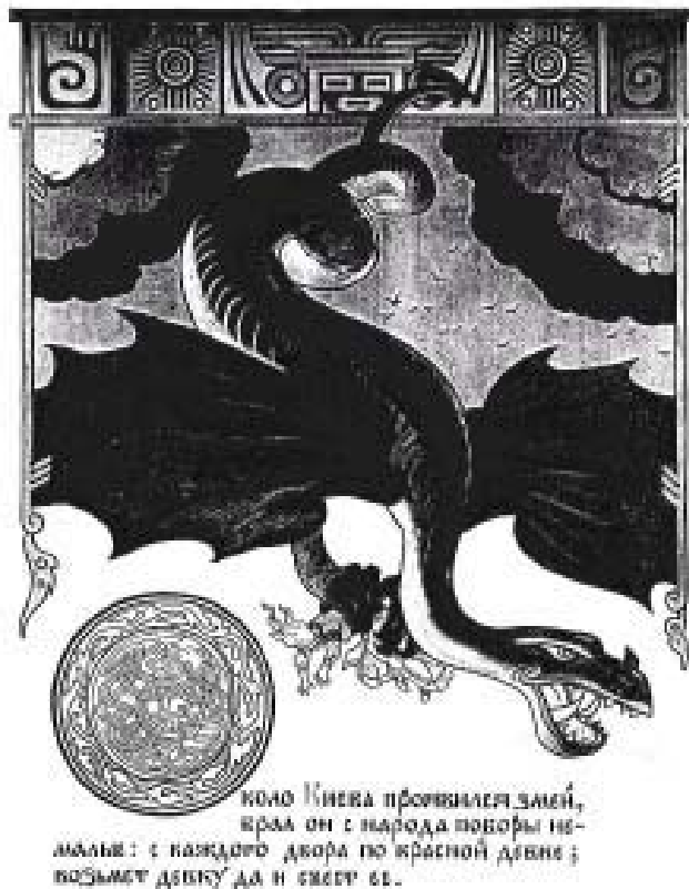
Рис. 2. Иллюстрация к сказке «Никита Кожемяка». В. Лукьянец.

В духовных стихах о более известном змеборце, св. Георгии, также фигурирует змей: