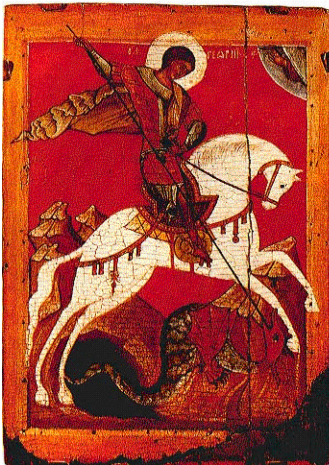
Рис. 3. Чудо Георгия о змие. Вторая половина XV в., Новгород. Дерево, яичная краска. Государственный Русский музей, С.-Петербург.

В русских духовных стихах змей – символ зла и греха. Обратимся к стиху «Плач Адама» о крещении Христа. Г. Федотов так о нем пишет: «Обновление мира крещением Христа связывается с очистительной силой водной стихии и мыслится по аналогии с крещением-таинством. В лице Христа как бы крестится, очищаясь от грехов, вся земля». И в продолжение Федотов цитирует стихи: