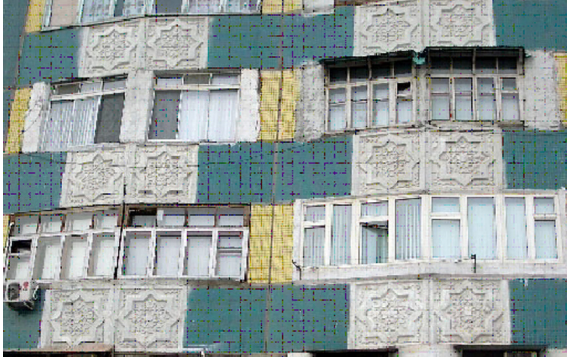
〔写真 5〕 押し型技法のパネル装飾例

強い日差しにも剥落しない特別タイルが住宅コンビナートの工場生産されていた (69) 。建設後 40 年を経た現在でもタイルは剥落せず、建設当初の鮮やかな色彩を保つ。歴史建造物と同様、パネル式集合住宅の壁面でも青色が使用される頻度が高く、これは焼成温度と経費削減の影響もあった (70) 。