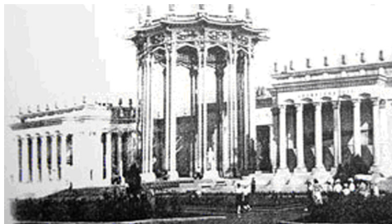
〔写真1〕1954年再建の全ソ連農業展示会 ウズベキスタン・パヴィリオン

1939年にモスクワで行われた全ソ連農業展示会 (Всесоюзная сельскохозяйственная выставка) 出展の仮設パヴィリオン「ウズベキスタン・トルクメニスタン館」〔写真1〕は後に「ウズベク・ナショナル様式」 (28) と総称されるソヴィエト建築とウズベキスタンの伝統的な壁面装飾文化の結合が大々的に行われ、モスクワで評価を確立した記念的建築と位置づけられる。