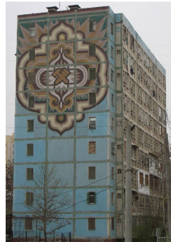
〔写真 6, 7, 8〕 パネル住宅の側壁ファサード装飾例