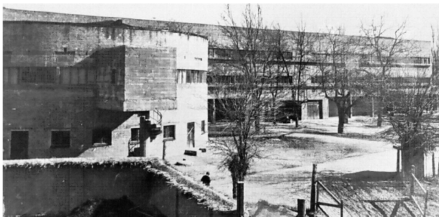
〔写真2〕 タシケントのドム・コムーナ (1931年)

る事であり、建設する事自体に意義があったと推測される。最初期の集合住宅は構成主義の作風で、装飾は排され、その後のスターリン様式主義の集合住宅では西欧古典の建築装飾が施され、広めのベランダ設置など平面の一部に気候・地域性への考慮を見ることが