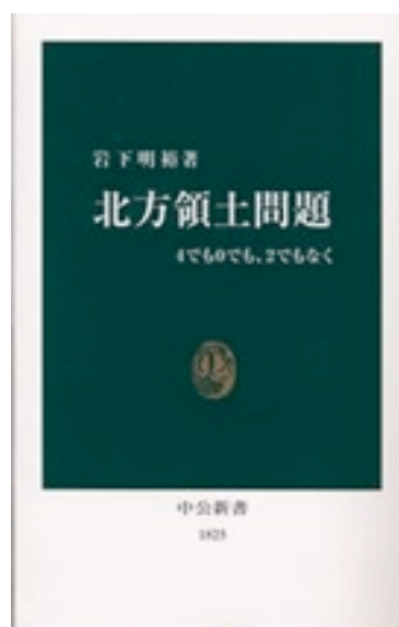
岩下明裕著 『北方領土問題：4でも0でも、2でもなく』 中公新書 2005年